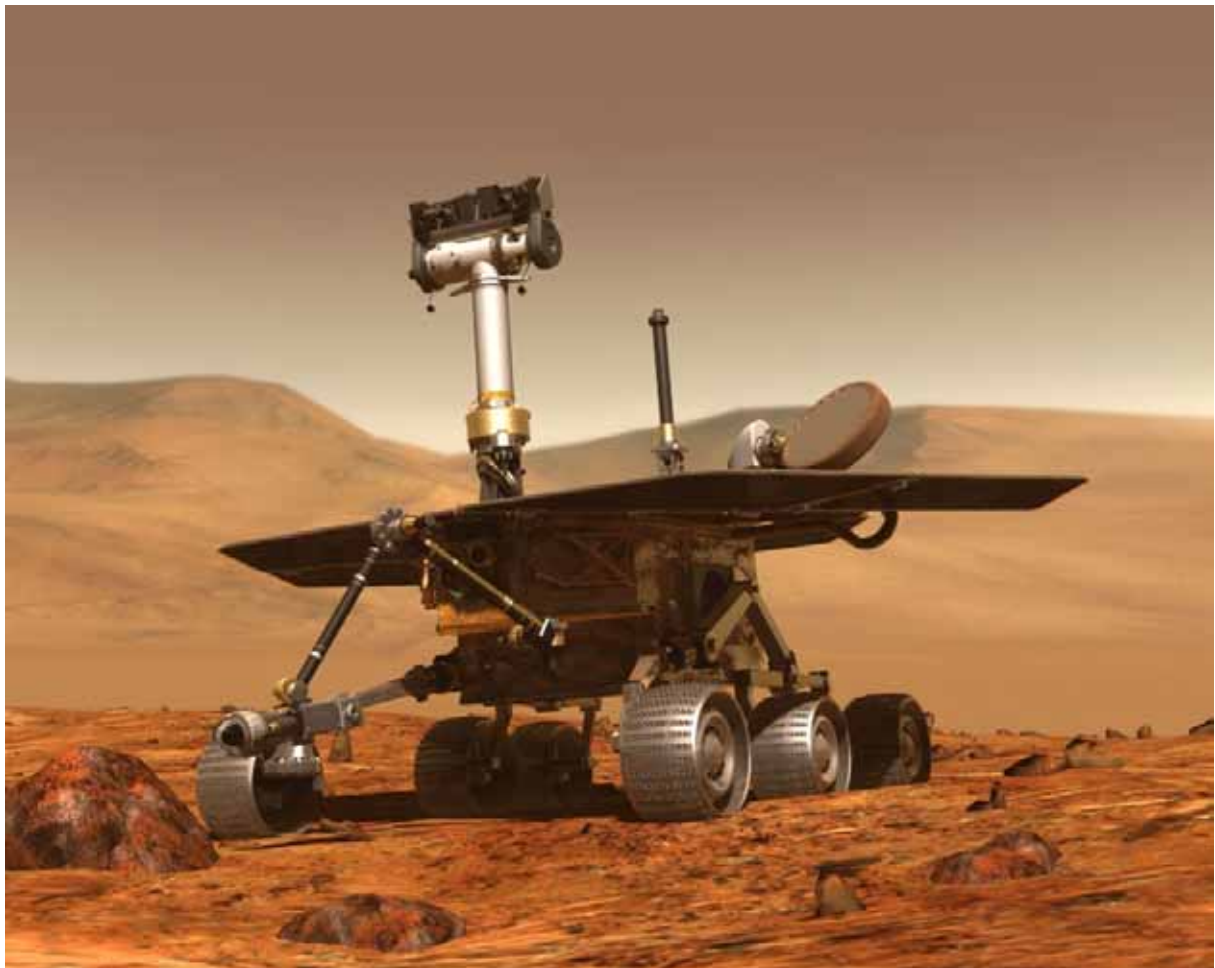
Abb. 1 Mars Exploration Rover. Links im Vordergrund sieht man den robotischen Arm, an dem zwei Spektrometer, ein Mikroskop und das Fräswerkzeug RAT angebracht sind.

Die beiden identisch ausgestatteten Rover Spirit und Opportunity (Abbildung 1) sind etwa 1,6 m lang, 1,5 m hoch und 174 kg schwer. Sie fahren auf sechs Rädern und werden von Solarstrom betrieben. Der wissenschaftliche Leiter der Rover-Mission ist Steven Squyres von der Cornell University in Ithaca (Bundesstaat New York, USA).