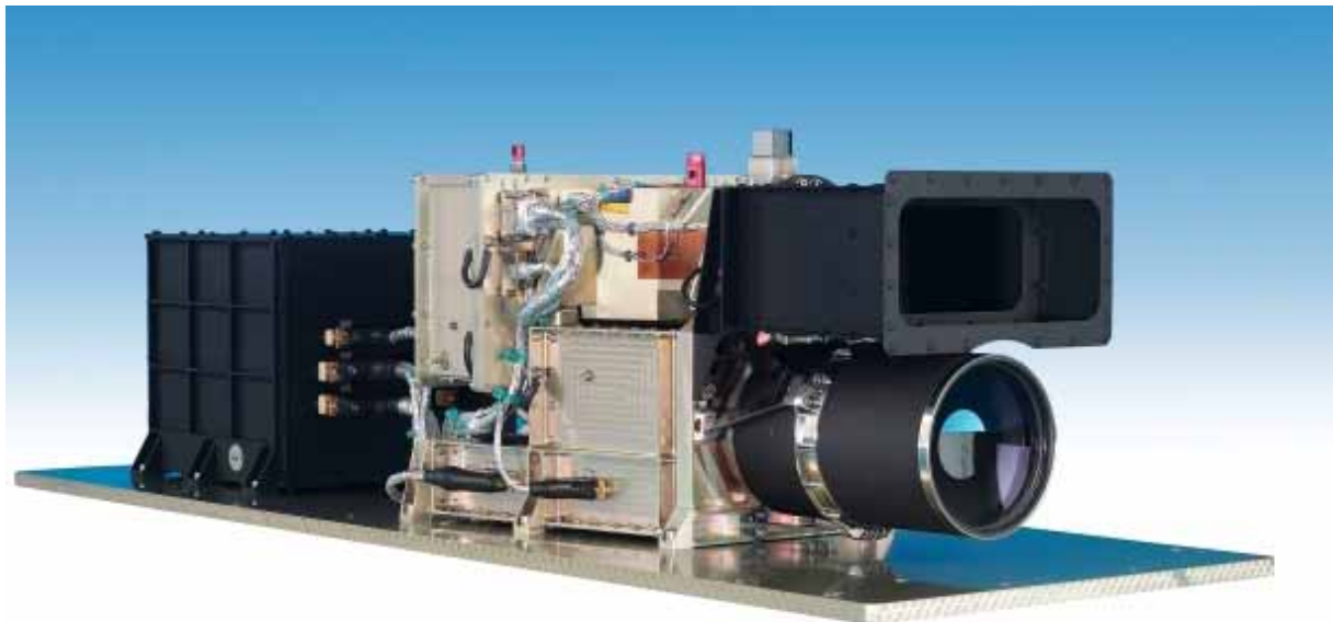
Abb. 3 Die deutsche Hochleistungskamera HRSC (High Resolution Stereo Camera) an Bord von Mars Express.

Die HRSC ist eine hoch auflösende Stereokamera, die am Deutschen Zentrum für Luft- und Raumfahrt (DLR) entwickelt wurde (Abbildung 3). Sie stellt ein in dieser Form bislang einmaliges Experiment dar: Zum ersten Mal auf einer Weltraummission bildet eine Spezialkamera eine Planetenoberfläche systematisch in drei Dimensionen und in Farbe ab. Die räumliche Auflösung der Stereobilder übertrifft bisherige topographische Daten bei weitem und erlaubt es den Geowissenschaftlern, Details mit einer vertikalen Genauigkeit von zehn bis vierzig Metern zu analysieren. Der Schwerpunkt der wissenschaftlichen Auswertung liegt in der geomorphologischen Analyse des Oberflächenreliefs.