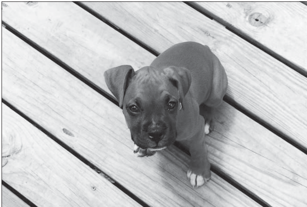
Abbildung 1.4: Ein Welpen ist eine Bereicherung für Ihre Familie – jedoch eine, die auch sehr viel Geduld erfordert.

Die Welpenzeit ist immer gut für Überraschungen und Freuden. Sie sollten sie aber nur auf sich nehmen, wenn Sie hinter der Entscheidung, einen Babyhund bei sich aufzunehmen, wirklich stehen und wenn Sie gewährleisten können, dass in den ersten Lebensmonaten immer jemand zu Hause ist. Mit einem 9-to-5-Job können Sie sich ohnehin keinen Welpen zulegen (und auch die meisten erwachsenen Hunde nicht). Denn wenn Sie nicht genug Zeit und Liebe investieren, haben Sie nachher eventuell einen Hund, der Sie um den Verstand bringt – oder den Sie schlimmstenfalls abgeben müssen, da Sie mit ihm nicht mehr fertig werden.