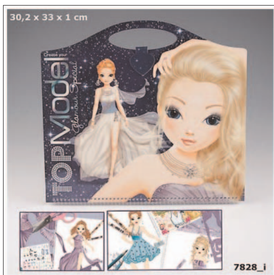
Abbildung B2.8 Die Malbücher von Top-Model.biz

Dieses Netzwerk beziehungsweise Portal dient in erster Linie dazu, die mithilfe der Top-Model-Bücher selbstgemalten Bilder auf seinem Profil hochzuladen (Abbildung B2.8). Diese können dann durch andere bewertet und kommentiert werden. Außerdem gibt es dort eine Reihe von Spielen, Chat- und Nachrichtenfunktionen sowie eine Art Shop, in dem man sich über die Produkte und Malbücher informieren kann. Gekauft werden kann hier aber nichts.