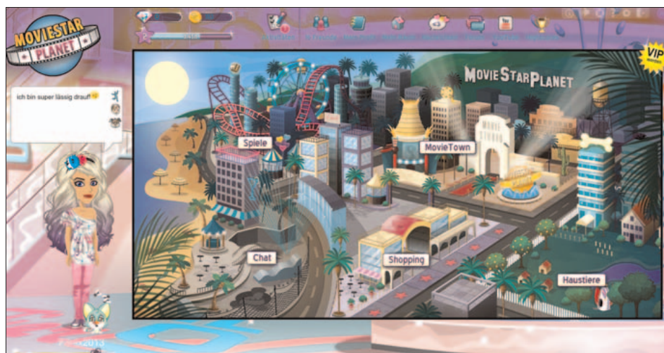
Abbildung B2.3 Die MovieStarPlanet-Landkarte

Auf MovieStarPlanet können Kinder von 8 bis 15 Jahren dem Traum nachgehen, reich und berühmt zu werden. Im Gegensatz zum Kindernetz steht bei MovieStarPlanet wieder deutlich das Netzwerken im Vordergrund: Wer mehr Freunde hat, kann mehr virtuelles Geld verdienen und steigt im Berühmtheitsrang eher auf eine höhere Stufe. Laut Hersteller wird eine »sichere, überwachte und spaßige Social-Network-Plattform« geboten. Die Nutzer können sich einen sogenannten Avatar, also eine individuelle Spielfigur, nach eigenen Wünschen kreieren (ein Beispiel dafür sehen Sie links in Abbildung B2.3).