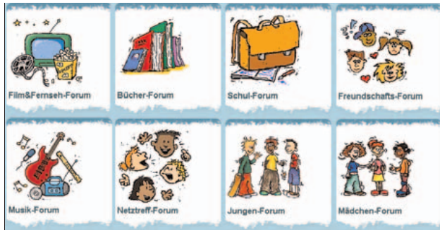
Abbildung B2.19 Foren auf kindernetz.de