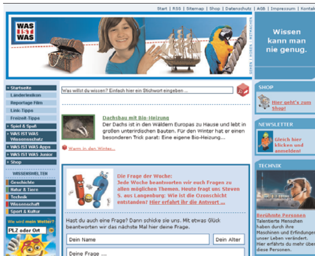
Abbildung B2.18 Wasistwas.de