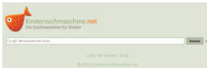
Abbildung B2.14 Kindersuchmaschine.net