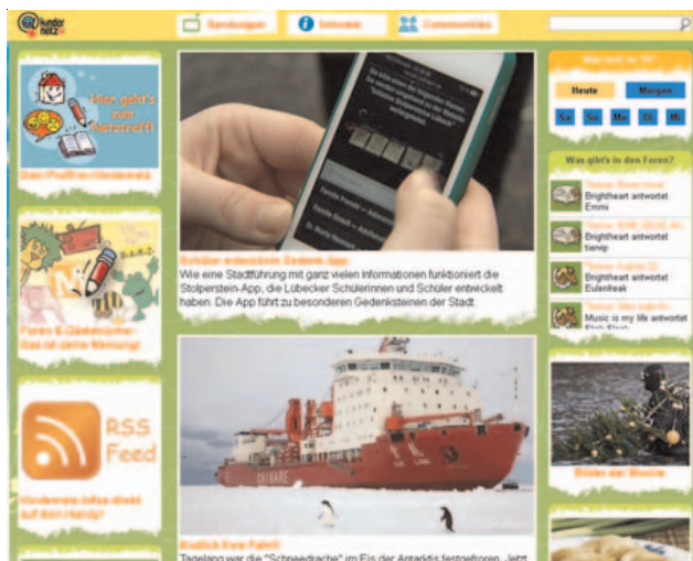
Abbildung B2.1 Die Startseite vom SWR-Kindernetz

Auch hier gilt: Es gibt nicht nur die Netzwerke, die ich hier vorstelle, aber es ist eine kleine Auswahl für Sie, bei der Sie beruhigt sagen können, dass Ihr Kind hier relativ gefahrlos das Internet kennenlernen kann.