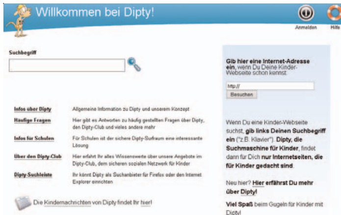
Abbildung B2.11 Dipty.de