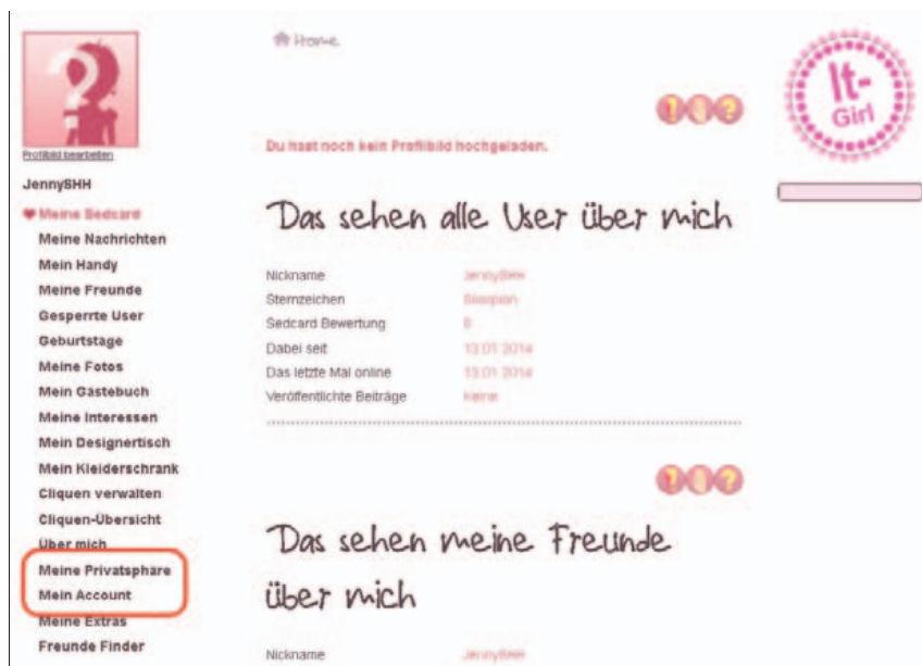
Abbildung B2.9 Das eigene Konto bei Top-Model.biz

Die wichtigen Sicherheitseinstellungen sind über das Profil zu erreichen (Abbildung B2.9). Hier können Sie die Privatsphäre-Einstellungen und auch die Konto-Informationen zu persönlichen Informationen Ihres Kindes eintragen. Das Tolle ist, dass grundsätzlich alles auf kleinster Freigabestufe (für niemanden sichtbar) eingestellt ist, bis es ausdrücklich geändert wird.