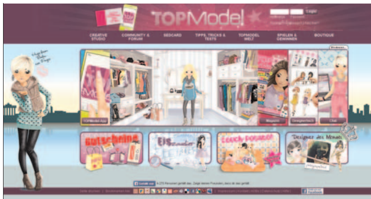
Abbildung B2.7 Die Übersicht bei Top-Model.biz

Dieses Netzwerk beziehungsweise Portal dient in erster Linie dazu, die mithilfe der Top-Model-Bücher selbstgemalten Bilder auf seinem Profil hochzuladen (Abbildung B2.8). Diese können dann durch andere bewertet und kommentiert werden. Außerdem gibt es dort eine Reihe von Spielen, Chat- und Nachrichtenfunktionen sowie eine Art Shop, in dem man sich über die Produkte und Malbücher informieren kann. Gekauft werden kann hier aber nichts.