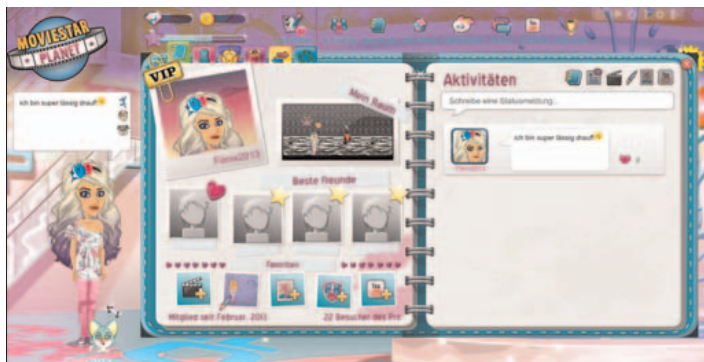
Abbildung B2.5 Das Profil bei MovieStarPlanet

Zudem gibt es dieses Spiel auch für Smartphones als App. Diese sind kostenlos und für das Android-Betriebssystem (zum Beispiel Samsung Galaxy) im Google Play Store und auch für das iPhone bei iTunes erhältlich.