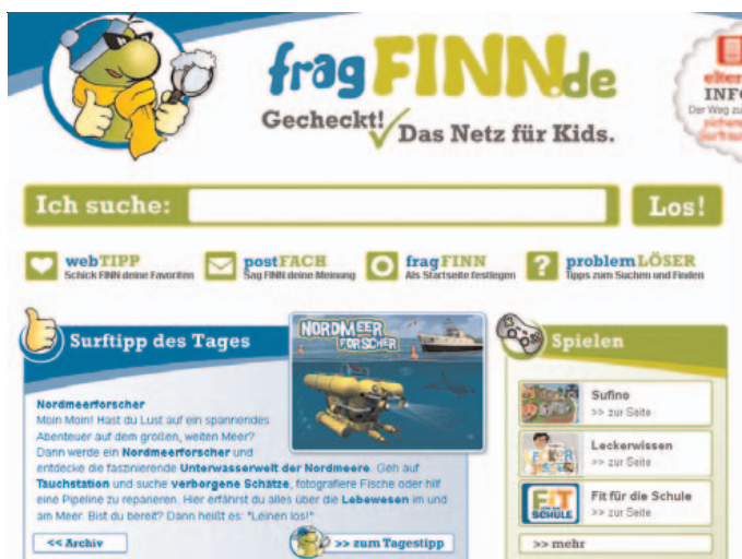
Abbildung B2.12 fragFINN.de