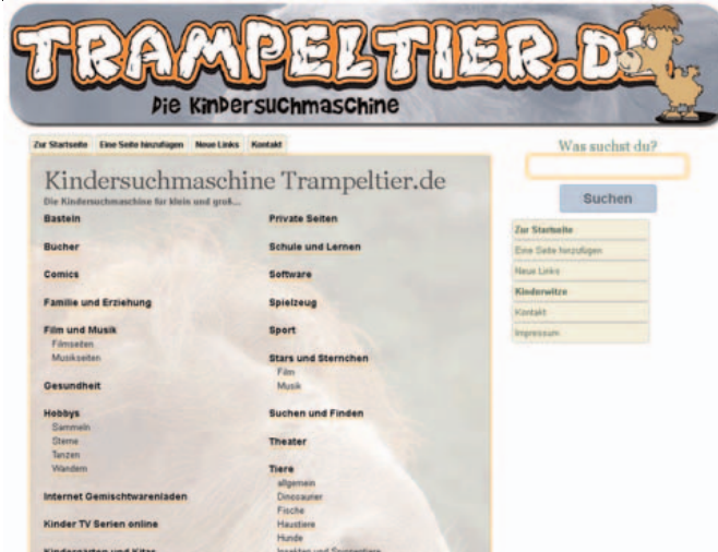
Abbildung B2.17