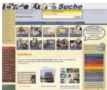
Abbildung B2.10 Blinde-Kuh.de