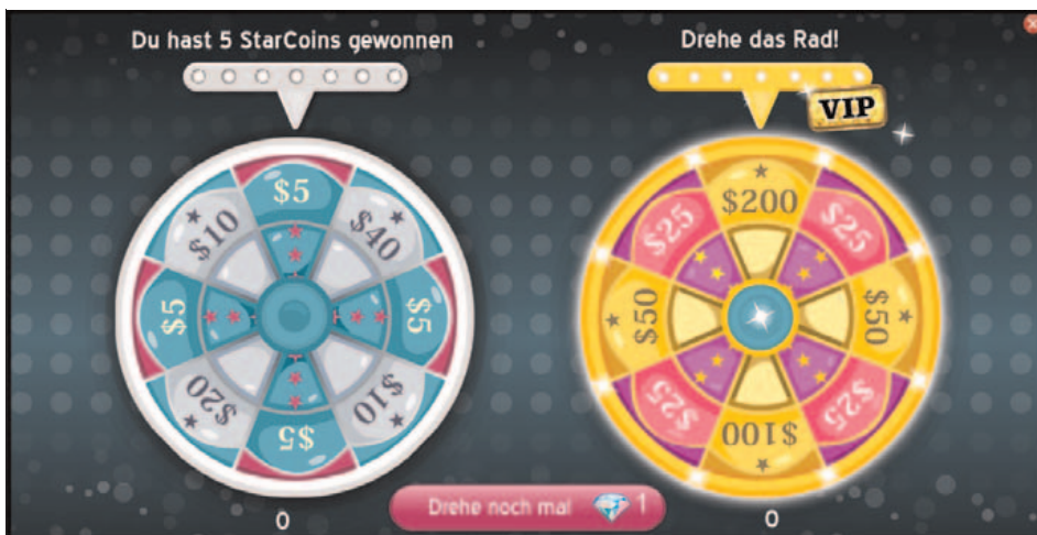
Abbildung B2.4 Die VIP-Nutzer können auch das rechte Glücksrad drehen, bei dem sie deutlich mehr virtuelles Geld gewinnen können.

oder Haustiere kaufen können. Ein großer Kritikpunkt aus meiner Sicht ist jedoch, dass einige Funktionen wie zum Beispiel das »Goldene Glücksrad« (siehe Abbildung B2.4) nur den VIP-Mitgliedern vorbehalten sind und für eine solche Mitgliedschaft auch noch permanent erworben wird. Die VIP-Mitgliedschaft ist jedoch mit bis zu 75 Euro jährlich eine eher kostenintensive Sache. Es ist hier also dringend erforderlich, dass Ihr Kind weiß, wie damit umzugehen ist.