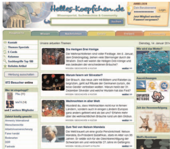
Abbildung B2.13 Helles-Koepfchen.de