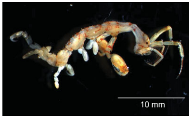
ABB. 1 Junges Männchen von Caprella mutica , die über 30 Millimeter groß werden können. Weibchen sind mit einer maximalen Körperlänge von 15 Millimetern deutlich kleiner.

In Nord- und Ostsee finden sich zunehmend Organismen aus fernen Ländern, die mit Schiffen oder durch Aquakultur in unsere heimischen Gewässer verschleppt werden. Kürzlich ist eine neue Krebsart aus Asien an der Nordseeküste entdeckt worden, die nun massenhaft Hafenanlagen, Boote und Seetonnen besiedelt.